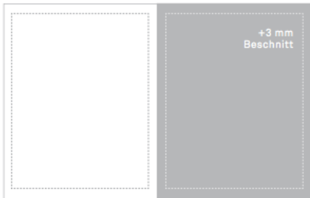
1/1 Seite 210 x 297 mm