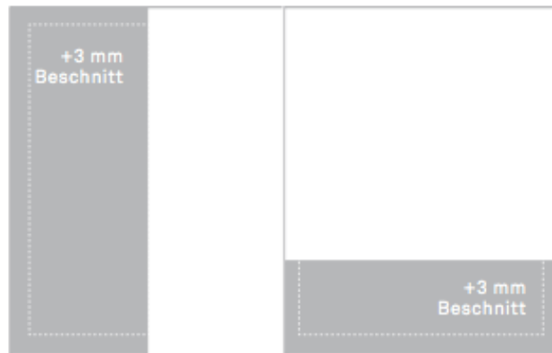
1/2 Seite 105 x 297 mm